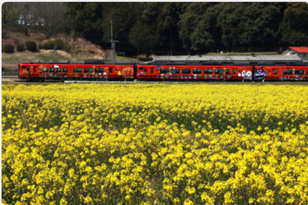
「菜の花畑とアンパン列車」 長井 遼介 様