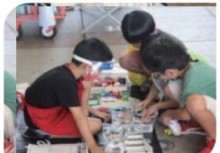
値下げ交渉にも挑戦!