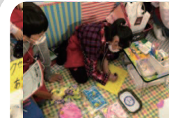
ポップでお店をアピール