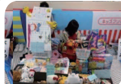
見えやすいように陳列