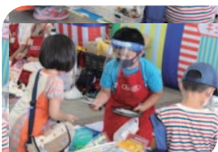
本物のお金を使用