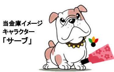
当金庫イメージキャラクター「サーブ」