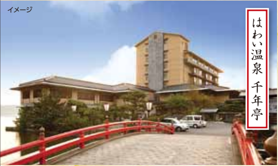
はわい温泉 千年亭