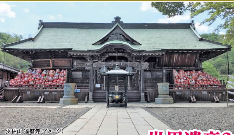
少林山 達磨寺(イメージ)