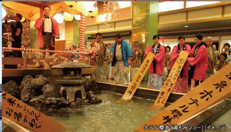
ホテル櫻井「湯もみショー」(イメージ)