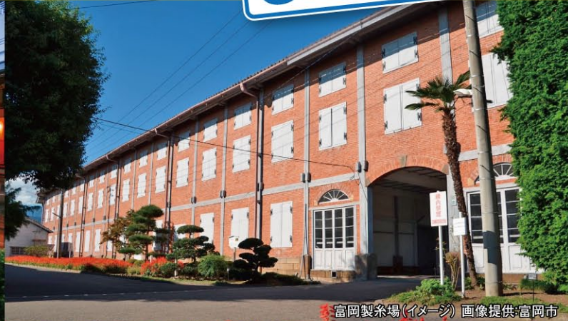
富岡製糸場(イメージ)