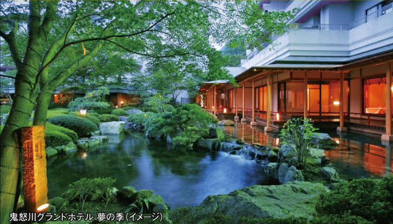
鬼怒川グランドホテル 夢の季(イメージ)