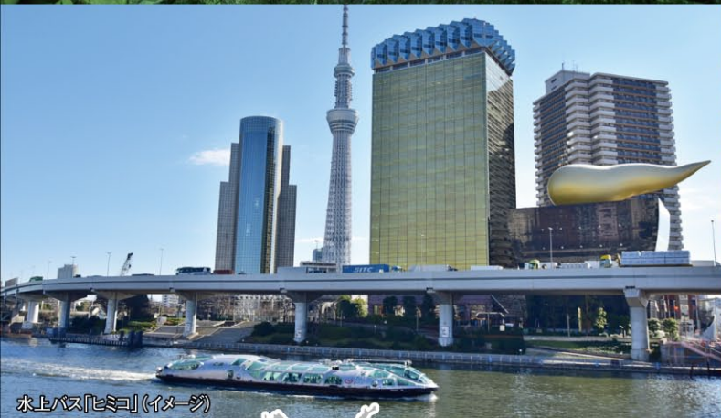
水上バス「ヒミコ」(イメージ)