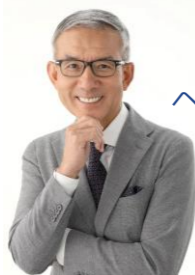
2024年 10月22日 2023WBC侍ジャパン ヘッドコーチ 白井 一幸 氏